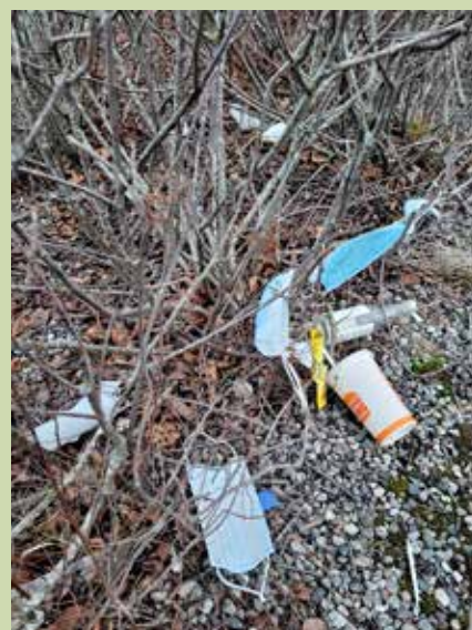
Spre glede ved å rydde plass for våren!

Og nettopp derfor trenger vi sånne folk som deg. Som gidder å bøye seg ned og plukke opp søppel som andre folk har kastet fra seg. Dessuten er det jo frivillighetens år nå i 2022. Du blir en del av den store frivillighetsdugnden. Du gjør noe som du ikke får betaling for, noe som du ikke er pålagt å gjøre, men som du snarere gjør fordi det gir deg en indre glede av å ha gjort noe som er til nytte og glede for noen andre, Ganske sikkert! Du hjelper både våren, alt som skal spire og gro, småkryp og større dyr. Og du hjelper deg selv - og gleder mange flere enn deg selv.